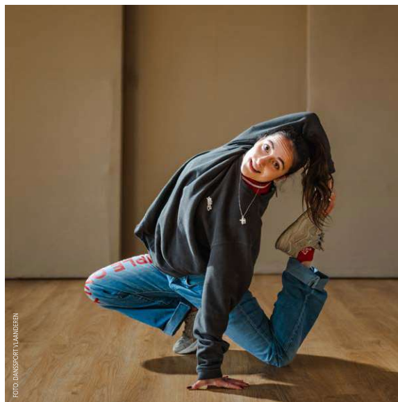
Breaking