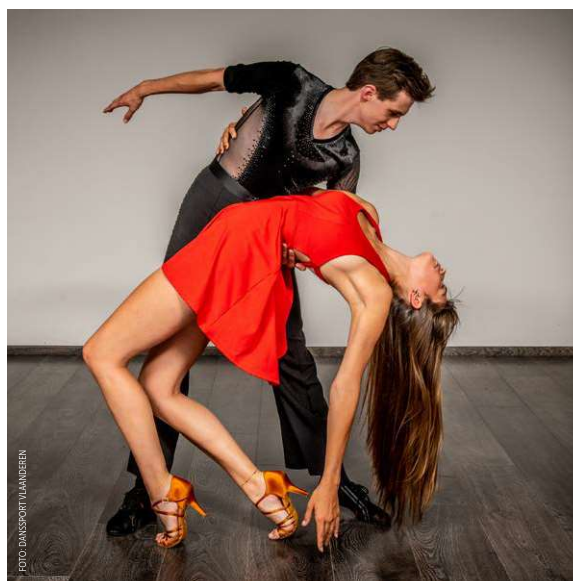
Latin