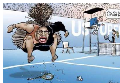
Lachen met de uiterlijke kenmerken van Justine Henin mocht, met die van haar generatiegenote Serena Williams niet.

Duitsers is in een cartoon steevast beets, draagt een grote pul bier en Tiroler lederhose. Of een pinhelm. Niet altijd smaakvol of gepast, maar het mag. Toen echter in een sportcartoon een kwade Serena Williams werd afgebeeld met een dik achterwerk, dito lippen en kroeshaar, was er in de pers sprake van 'racistische stereotypering'.